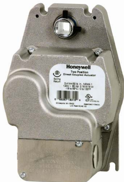
3,4 Nm e 9 Nm